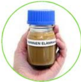
Déchets de graisse de l'industrie de la viande et du poisson