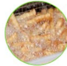
Huiles de fritures usagées